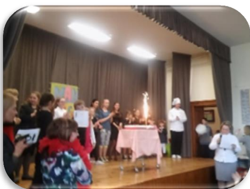
Oprócz wielu atrakcyjnych nagród, uczestnicy zjadali się smacowym tortem